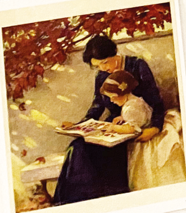
Billede udvalgt af unge på workshop for at illustrere vigtigheden af at fagpersoner lytter til den enkelte